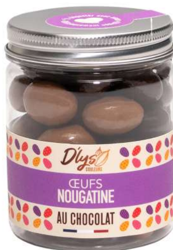
OEUFS NOUGATINE AU CHOCOLAT 200g : 10,43 € HT - 11 € TTC