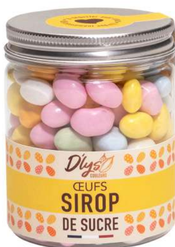
OEUFS EN SUCRE 200g : 7,50 € HT - 9 € TTC