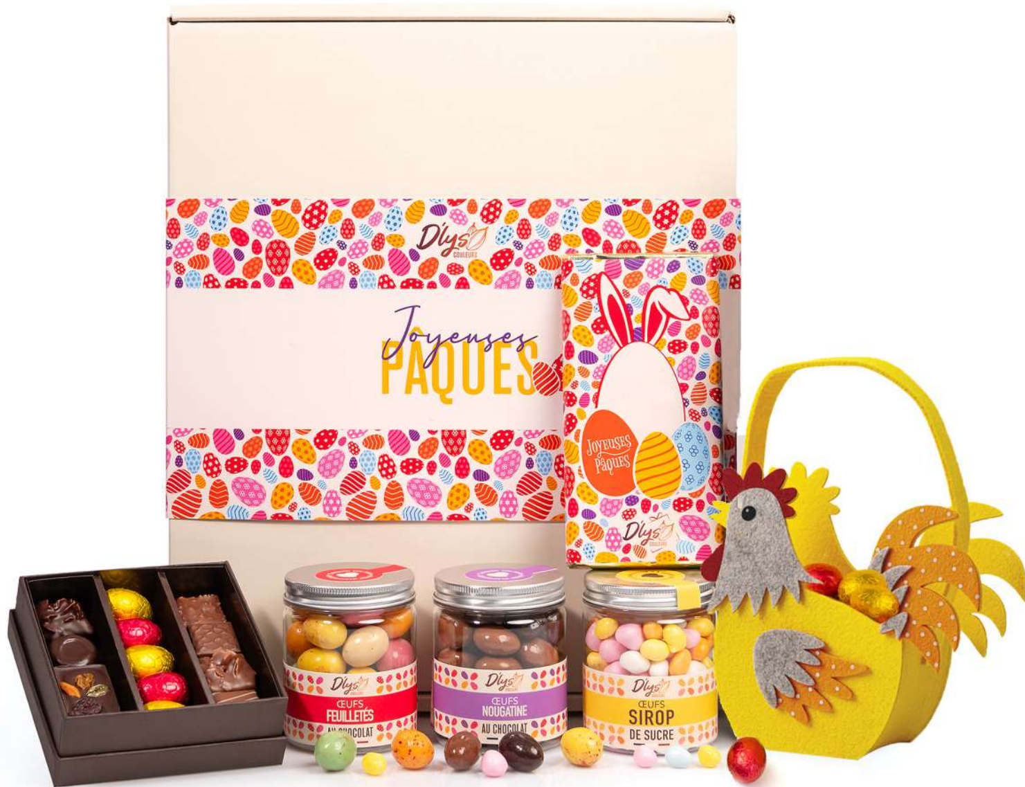
JOYEUSES PÂQUES Coffret avec chocolats, oeufs, Tablette de chocolat, Poule en feutrine 65,40 € HT - 69 € TTC