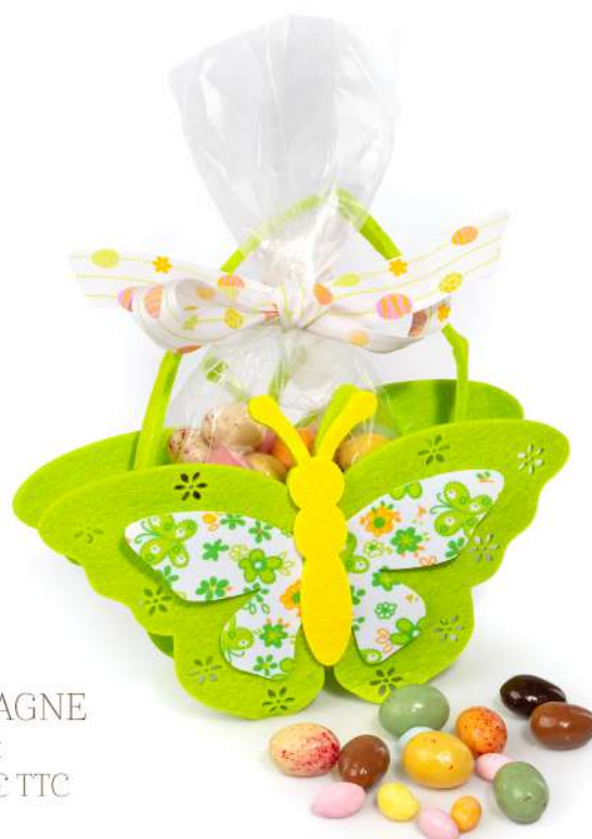
PÂQUES À LA CAMPAGNE 160g d'oeufs en chocolat 160g : 16,59 € HT - 17,50 € TTC