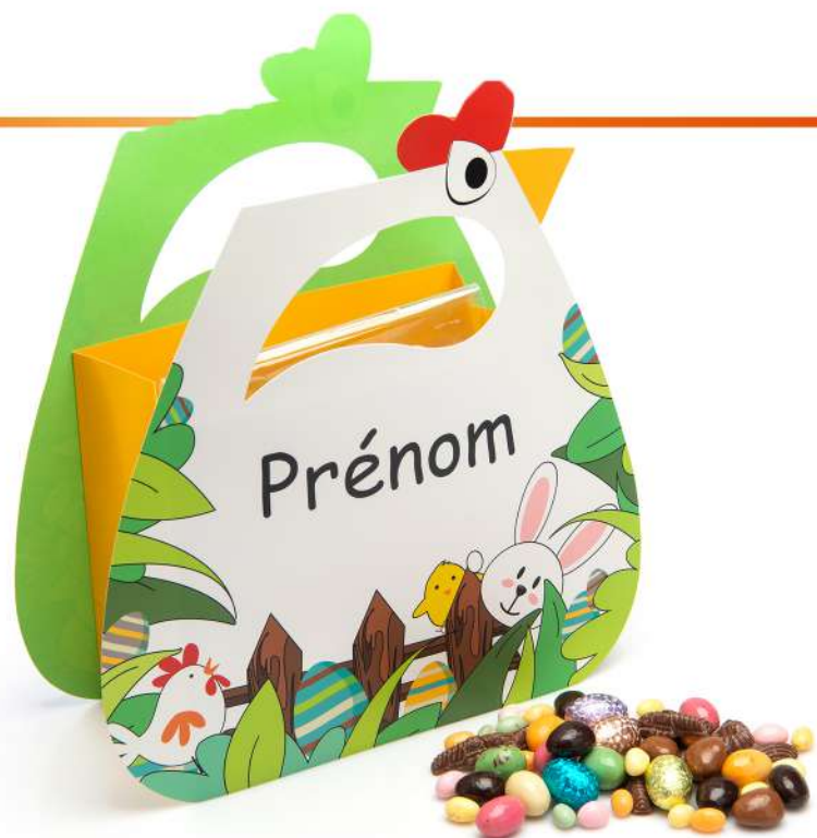
RITA, LA POULE DE PÂQUES Assortiment d'oeufs en chocolat et en sucre 1 Kg : 46,45 € HT - 49 € TTC