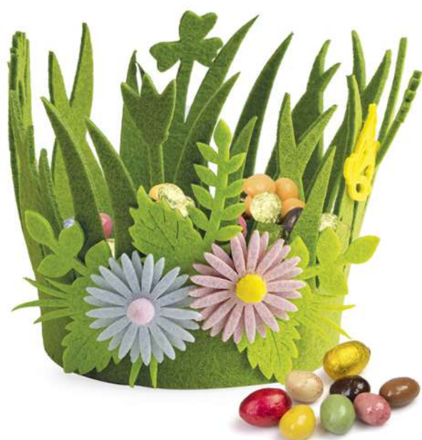
ENVIE DE PÂQUES 400g d'oeufs en chocolat 27,96 € HT - 29,50 € TTC