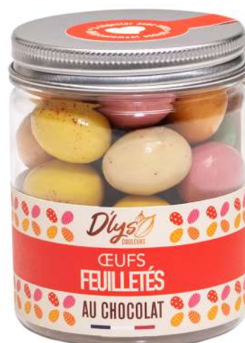
OEUFS FEUILLETÉS AU CHOCOLAT 200g : 10,90 € HT - 11,50 € TTC